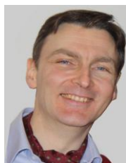
JL. ALVARES DE AZEVEDO